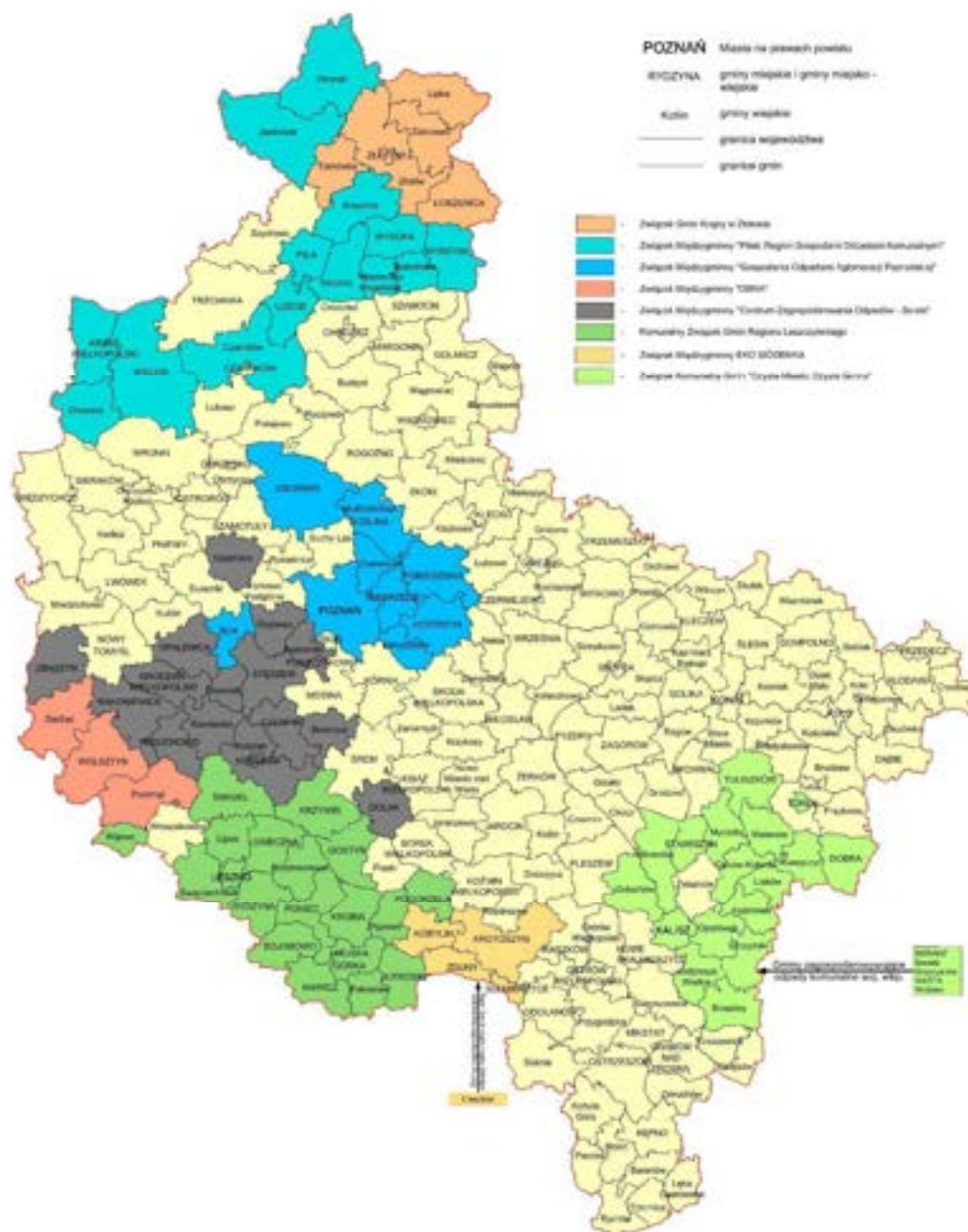
Rysunek 1. Komunalne Związki Gmin prowadzące wspólnie działania z zakresu gospodarki odpadami komunalnymi na terenie województwa wielkopolskiego.